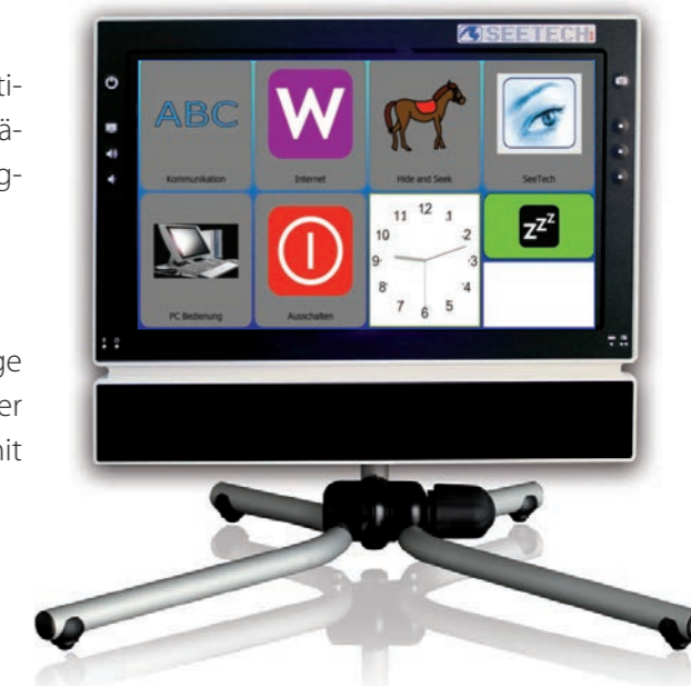
SeeTech® ONLY Augensteuerungsmodul