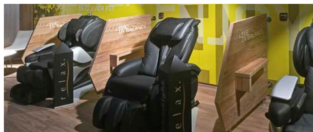
brainLight-Tiefenentspannungssysteme bei clever fit