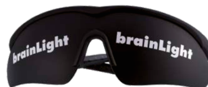
Visualisierungsbrille DARK EDITION blickdicht