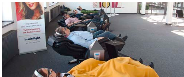
brainLight -Tiefenentspannung bei Brose Fahrzeugteile Coburg