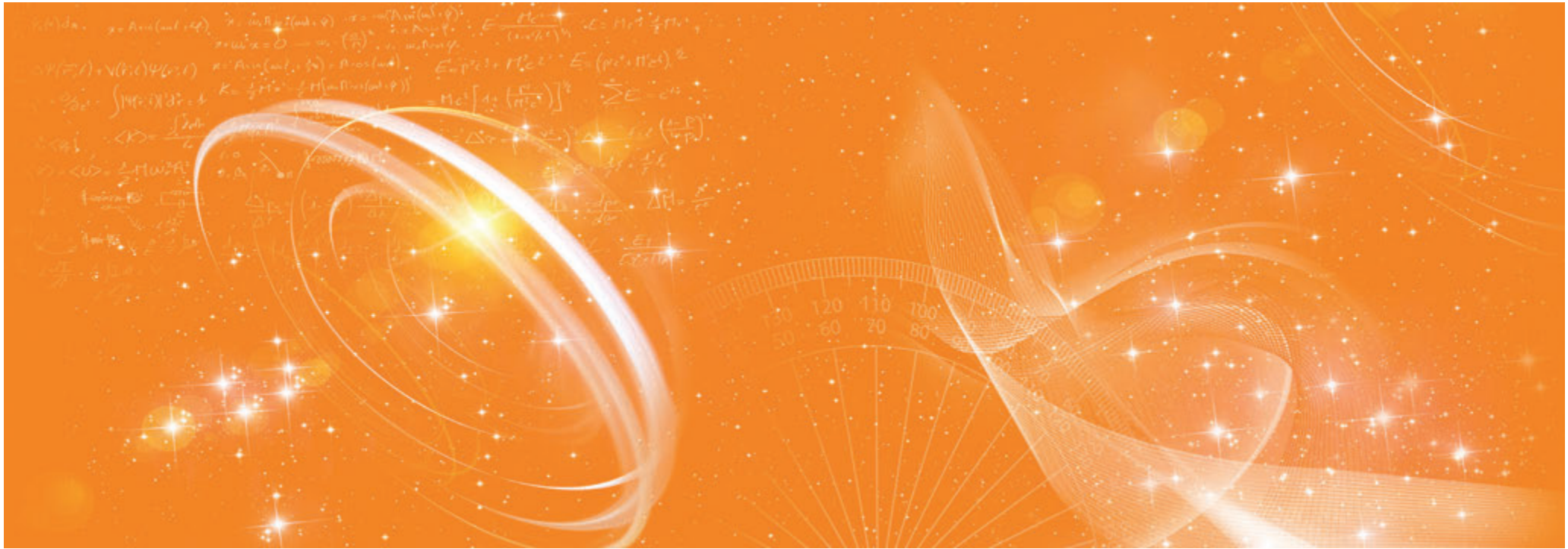
SRH Stephen-Hawking-Schule