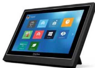
HK Pro Serie