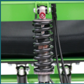
Einstellbare Rückenfederung mit variabel anpassbarer Rebound-funktion

Alle Ausstattungsmöglichkeiten finden Sie auf dem Bestellblatt des entsprechenden Rollstuhls