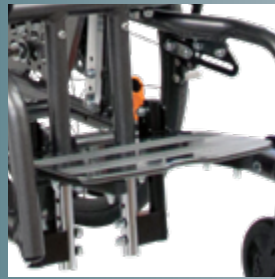
Dynamische und gefederte Beinstütze