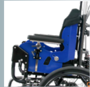
Ergonomische Sitz- und Rückeneinheit