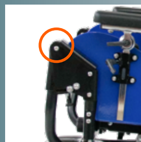
... und an den Knien