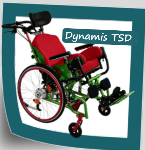
Der dynamische Kantelrollstuhl

Kontrollierte Bewegungsführung statt starrer Fixierung