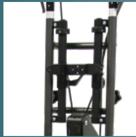
Rückenführung mit Adapter für den Anbau eines Sitzschalensystems