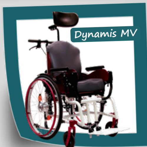
Der dynamische Aktivrollstuhl